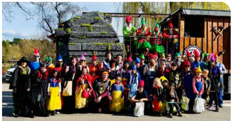
Pudenis asbl huet de 15. Mäerz un der Réimecher Cavalcade deelgeholl. L'asbl Pudenis a participé le 15 mars à la Cavalcade à Remich.

Reparieren spart Geld, schont die Umwelt und bringt Menschen zusammen – auch in Lenningen. Jede gelungene Reparatur ist ein kleiner, aber wichtiger Schritt hin zu mehr Nachhaltigkeit und Verantwortung gegenüber zukünftigen Generationen. Die neue Second-Hand-Ecke leistet hierzu einen wertvollen Beitrag, indem sie Ressourcen schont, Müll reduziert und den CO 2 -Ausstoß verringert.